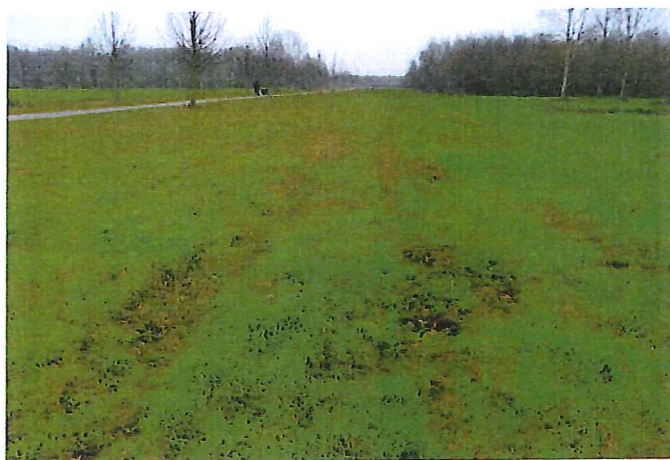
situatie november 2014

Het beeld na dit evenement was wel even schrikken, vanwege nattigheid en dergelijke. Dit is echter normaal na een dergelijk evenement in combinatie met afbouw. Dit heeft zich inmiddels weer hersteld (zie foto).